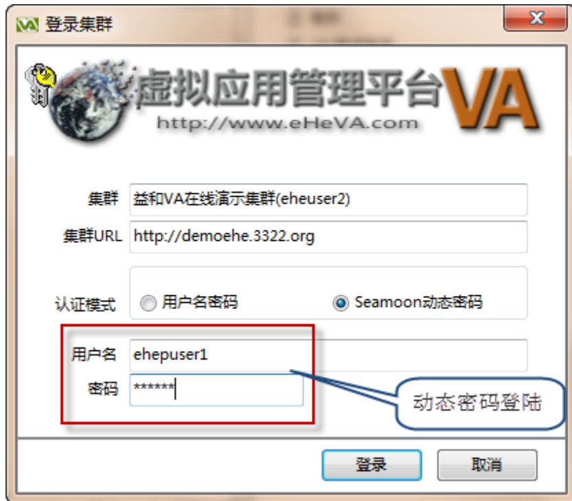
客户端图例三：登陆